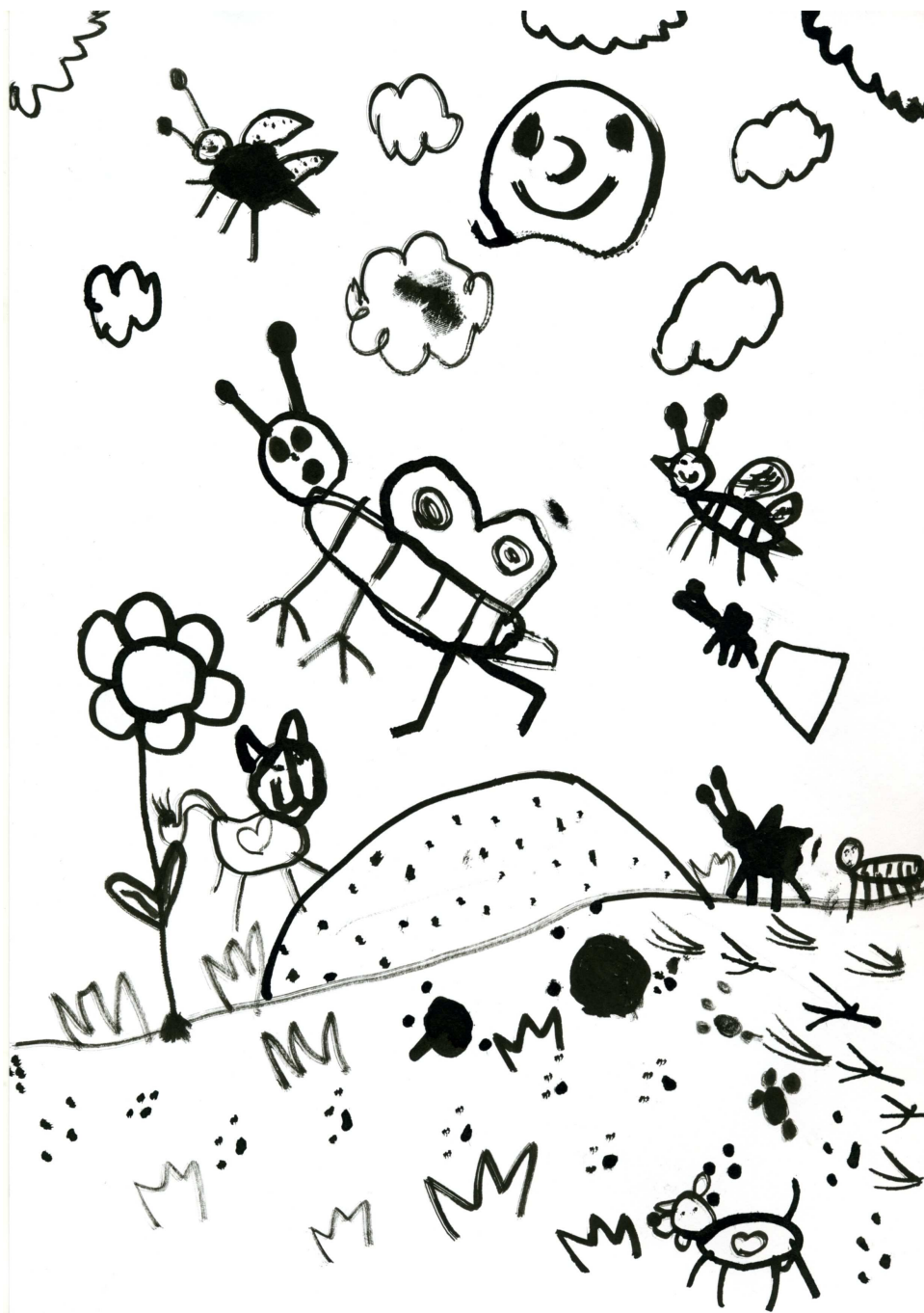
Kristýnka Kouřilová, 6 let

v letošním roce jsme opět přistoupili k vydání zpravodaje, abychom vás informovali o dění v naší obci.